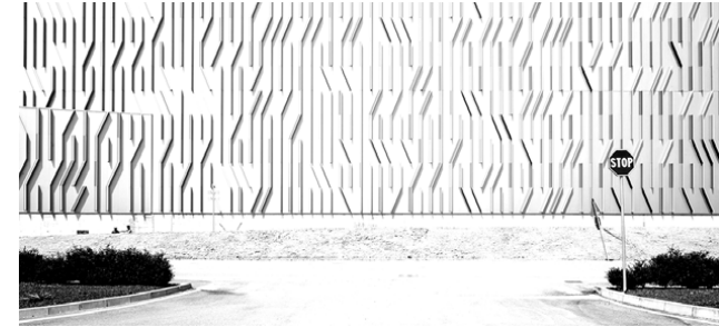
Magazzino Pedrali Cino Zucchi Architeti Mornico al Serio, 2016

Se questa è la felicità dell'architettura in mostra, il suo contrario, la sua infelicità è, invece, il puro esserci, la necrofila presenza in situ del corpo architettonico esibito come un animale impagliato nel museo di storia naturale. Di fronte ad architetture reali, come l'altare di Zeus, la porta di Ishtar eretti all'interno del museo Pergamon di Berlino, siamo colpiti da un disagio profondo. In quella traslazione che, come in un'operazione di teletrasporto, materializza,