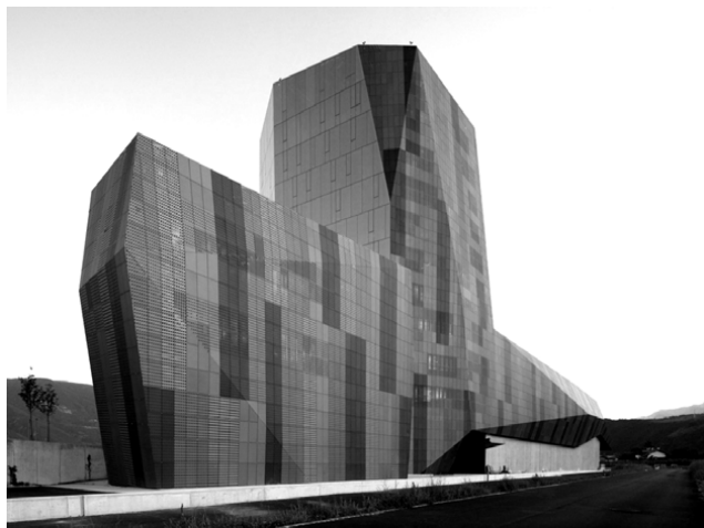
Salewa International Headquarters Cino Zucchi Architetti + Park Associati Bolzano, 2011