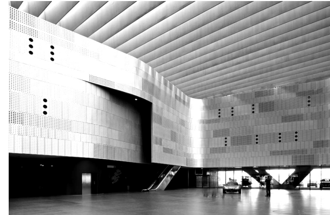
Museo dell'Automobile Cino Zucchi Architetti Torino, 2011

Credo che per concepire e realizzare questa mostra, e quindi an-