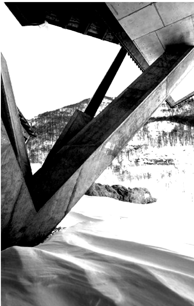
1301iNN, Elasticopia+3, Piancavallo