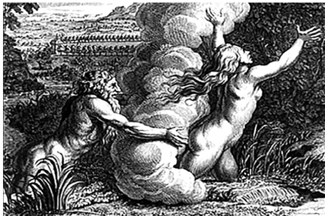
Mito di Aretusa e Alfeo Metamorfosi , V, 572 e seg Ovidio

È l’immagine e l’immaginario del bosco che ritrovo nella straordinaria architettura dell’hotel 1301iNN di Elasticospa+3, quel bosco dei sentieri Holzwege. Sembra un edificio artificiale-naturale, la