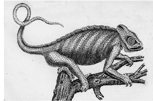
Litografia di un camaleonte 1832

diventano estreme, particolarmente ostili. Quando la montagna richiede misura e rispetto.